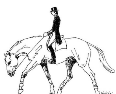
III. Dlouhý a nízký